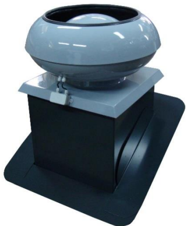
Przykładowy Cokół Uniwersal CSR